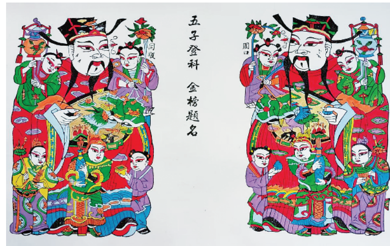
五子登科 金榜题名 穆广科作